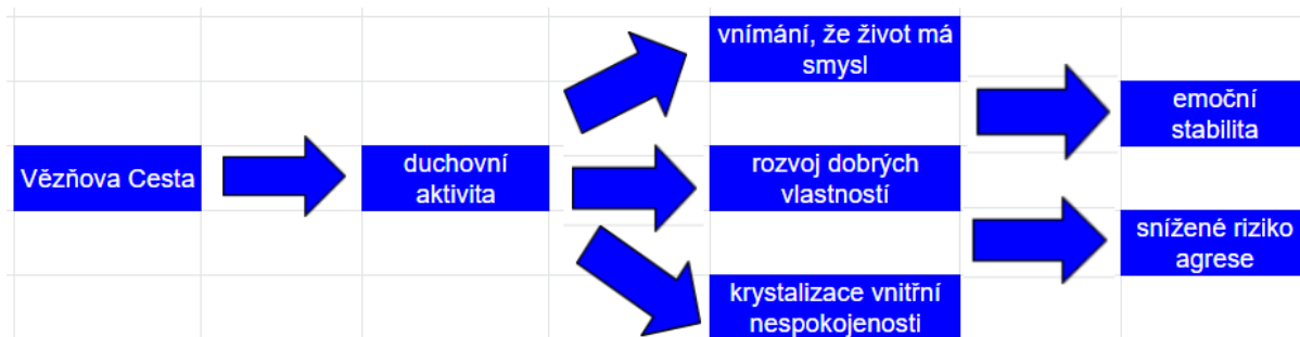
Graf 2 - sociální dopady Vězňovy cesty na nápravu a emoční stabilitu a chování vězňů

V Jihoafrické republice zvýšená duchovní aktivita jedinců přispěla k jejich vnitřní proměně, konkrétně skrze změny v jejich vnímání sebe sama a v rozvoji charakteru. 6 U uvězněných došlo k výraznému posunu v oblasti kognitivní a emoční identity a dále v rozvoji vlastností jako odpuštění, empatie, sebeovládání. To v důsledku vedlo ke zmírnění negativních emočních stavů (tj. stavů deprese, úzkosti a hněvu). Kromě těchto vedlejších výstupů jsme jako důsledek aktivního duchovního života zaznamenali všeobecný pokles výskytu negativních emočních stavů a vyšší výskyt odpuštění a sebeovládání a také pokles pravděpodobnosti výskytu agresivního chování mezi vězni navzájem.